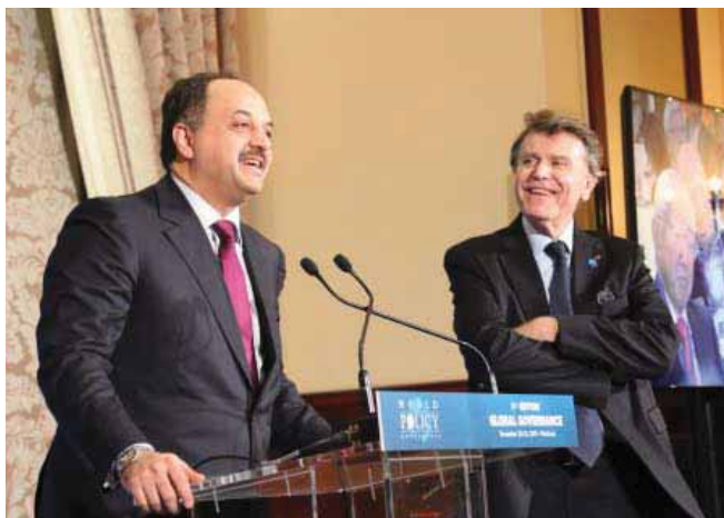
Khalid Bin Mohammed Al Attiyah, ministre des Affaires étrangères de l'État du Qatar, Thierry de Montbrial

Cette huitième édition de la WPC, qui s'est déroulée dans un climat empreint de gravité et de sérénité suite aux attentats terroristes à Paris, a apporté des éclairages nouveaux dans plusieurs domaines, afin de dessiner un tableau plus précis des nombreux défis de la gouvernance mondiale et en faire mieux mesurer l'ampleur.